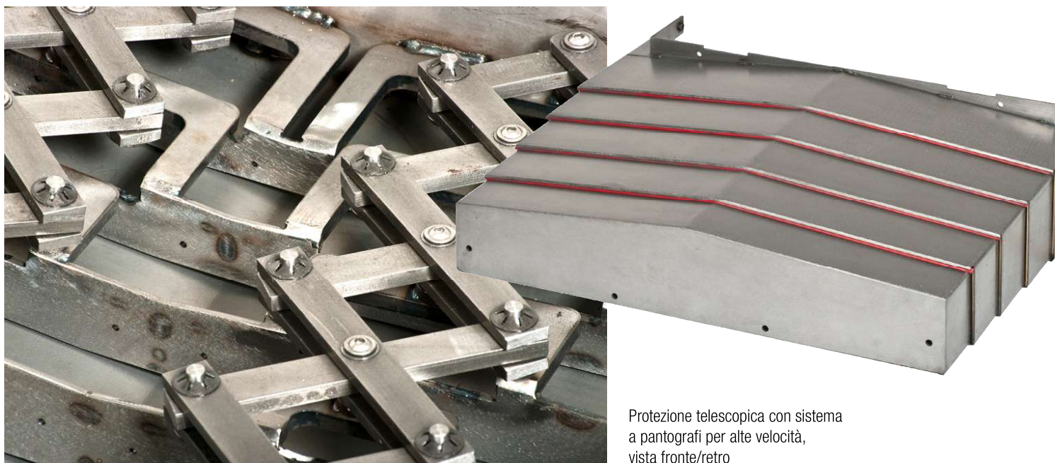
Protezione telescopica con sistema a pantografi per alte velocità, vista fronte/retro

Vogliamo entusiasmare i clienti, creando prodotti straordinariamente buoni, belli e ben fatti, lavorando efficientemente per la soddisfazione dei loro bisogni.