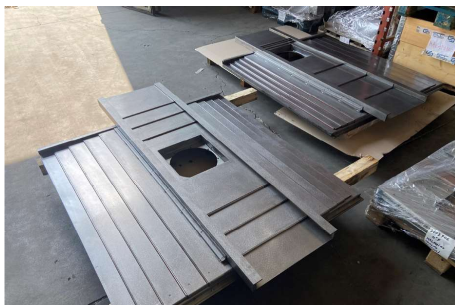
Protezione telescopica multi direzionale

ta". SCC è infatti fondata su questo senso di famiglia e sulla cultura aziendale ottimista, in cui i principi aziendali vengono condivisi proprio come in una seconda casa.