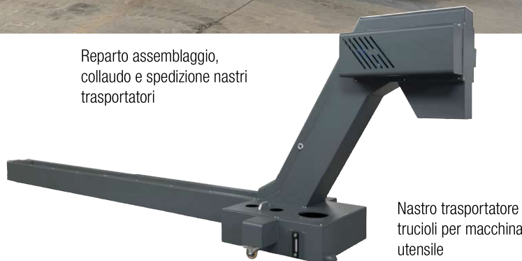
Nastro trasportatore trucioli per macchina utensile

sione; nastri trasportatori, a tappeto incernierato o draganti, con o senza vasche, personalizzati su specifica/disegno del cliente.